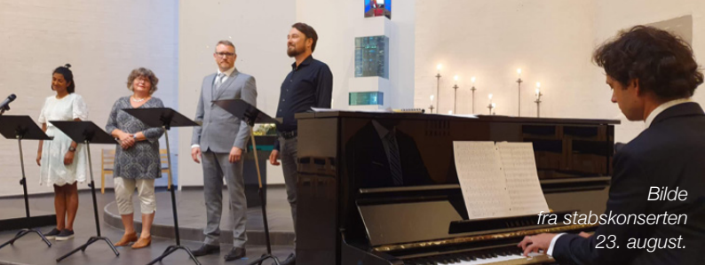
Bilde fra stabskonserten 23. august.