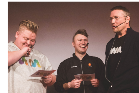
Ungdomsorganisasjonen «follow me»